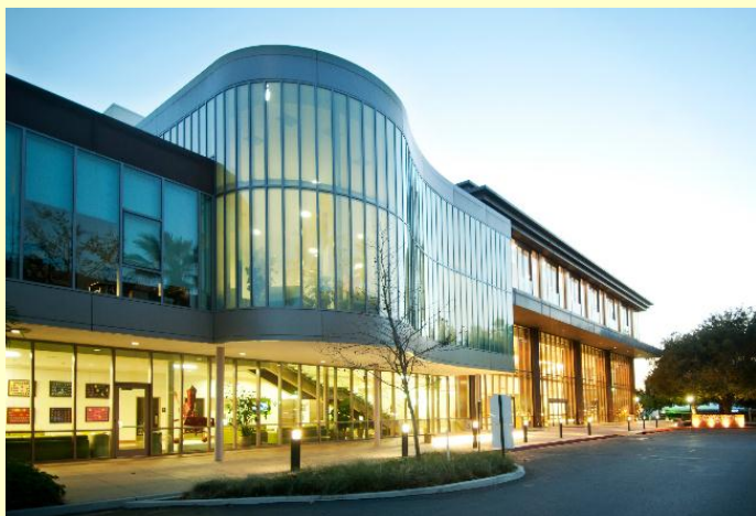
New Campus Center da University of La Verne