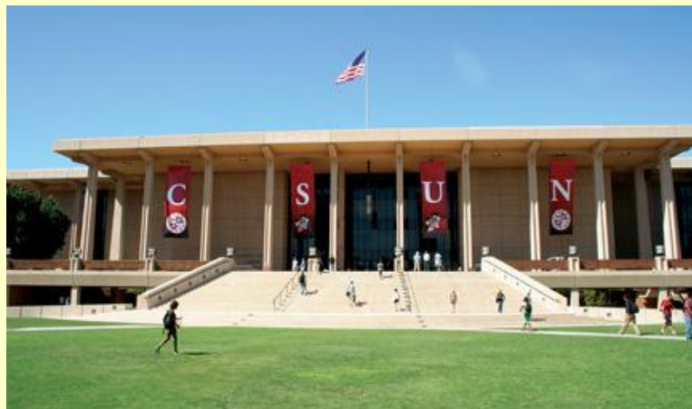
Biblioteca Central da California State University